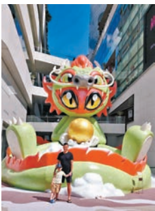
伯公與侄孫過農曆年於曼谷精靈龍前留影。

聘，前往南洋吉隆坡「同善醫院」行醫，在二戰之前民國時期，是鄉里間引以為傲的事情。舉家下南洋，臨行留下家族長子嫡孫，我們大伯，託他五弟我祖父照顧，某程度上祖父跟他長兄，及日後成為西醫的長侄的感情都比較親厚。 我上小學二年班，大伯婆回到家鄉，未幾離世。往後不久，大伯公亦回鄉，側聽村人耳語；這叫「回頭鳳」，鳳凰死前，必飛回出生的家鄉待逝。伯父伯娘的家在隔籬巷，他們的幼兒七仔比我小1歲，是我的童年玩伴，大伯公回鄉跟長子一同住，我與七仔常在他屋內玩耍，或時幫他搥背，事後每人獲贈5角，那些年不少鄉間作坊，婦女一天的工資不過1元5角，甚至1元，大伯公對孫子及侄孫的呵護可見一斑。 經歷4年疫情兼媳婦病重離世，弟弟和弟婦帶着長子孫兒回鄉度歲。侄孫剛剛5歲，去年3月筆者曾經回去多倫多探望患病中的侄新抱，跟4歲的小朋友植下明顯的感情，首次回來老家，伯公、伯公之聲叫個不停，忽爾進入時光隧道移形換影，自己返回聲聲叫着大伯公、大伯公，四伯公、四伯公的歲月，好不溫馨。