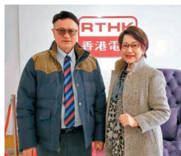
◆ 祝大家龍馬精神，疫情早日消散！

去……例如肺片是怎樣的？怎樣情況才入深切治療部？有什麼徵狀等等。我應約北上，難忘年初三那天一卡火車只有一個人，廣州市面行人疏落，那是從未見過的。這篇新冠的臨床徵狀報道頗為矚目，徵引數字超過1萬4千次，破了紀錄。」 據悉全球有7億人感染過新冠，7百萬因此死亡，而香港也有八九成市民中了招。現在不時聽到有人懷疑自己出現腦霧和不適，到底怎樣才知自己是否患上長新冠呢？「在世衛的定義，如果感染後超過3個月仍然有持續的徵狀，但那些都是有點含糊的……例如疲倦、氣喘、健忘、關節酸軟、頭痛頭暈、集中能力差等等，共有200多個病徵，現時各方對此病仍未完全了解，也沒有特別的藥可用，世衛建議有兩件事可以減低患上長新冠的機會，第一接種疫苗，中了也會減輕徵狀；第二高危組別中了，感染後盡早服用抗病毒口服藥。」 農曆新年快到了，今年是首個沒有口罩令的春節，希望大家好好保重自己，教授已打5針，準備打第6針了，你呢？祝龍年大家龍馬精神，疫情早日消散！