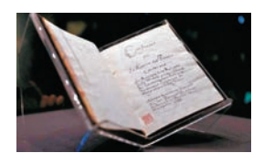
◆ 1688年法國出版的首部法文《論語導讀》收藏在中國國家圖書館。

2024年1月27日，國家主席習近平同法國總統馬克龍互致賀電，慶祝兩國建交60周年。1964年，在戴高樂將軍的推動下，法國成為第一個與新中國建交的西方大國。這個在當時大膽的決定被我國領導人視為法國獨立外交的典範。美國直到1979年才與北京建交。 猶記得2019年3月習近平主席訪問法國，馬克龍總統以1688年法國出版的首部《論語導讀》法文版原著作為國禮，贈送給習近平主席，還介紹說，《論語》的早期翻譯和導讀曾對孟德斯鳩和伏爾泰的哲學思想給予啟發。如今，碩果僅存的兩本《論語導讀》，一本存放在巴黎的法國國立吉美亞洲藝術博物館，一本由習近平主席帶回國，珍而重之收藏在中國國家圖書館。