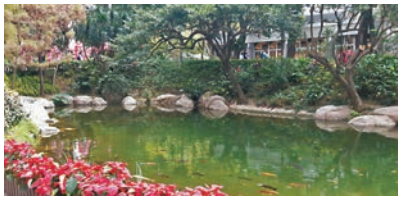
◆喜見可愛的香港公園滿載適度的人氣、旺氣……