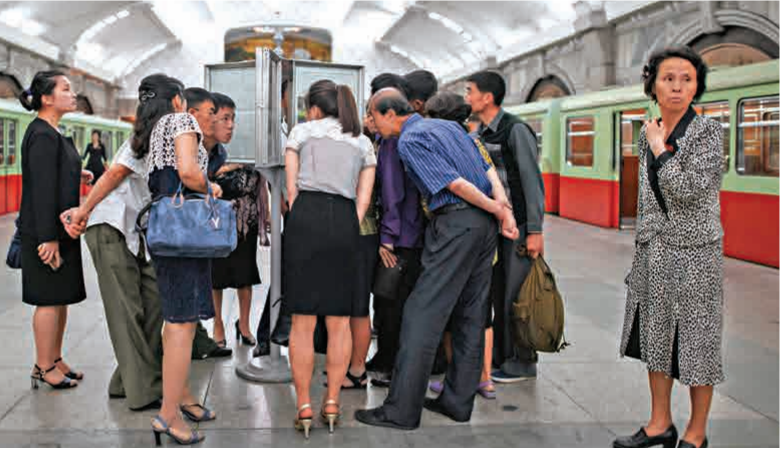
13日，朝鮮平壤地鐵裏的民眾正在圍觀朝鮮《勞動新聞》中關於特金會的新聞

【大公報訊】據朝中社、英國廣播公司及路透社報道：朝鮮最高領導人金正恩12日與美國總統特朗普在新加坡會面，全球媒體鋪天蓋地報道這一歷史性事件。13日，朝鮮媒體將此次會晤稱為「世紀之會」，表示金正恩進行歷史性會面後，同意朝鮮半島無核化需採逐步方式進行，並指特朗普作出了一些讓步。同日，特朗普在推文感謝金正恩，稱全球無核化又前進了一大步。