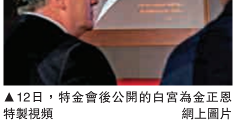
12日，特金會後公開的白宮為金正恩特製視頻

在影片放映過程中，一名解說員說，「過去並不一定就是未來」，畫面是被非軍事區分隔的朝鮮半島，接着解說員表示，「一個新世界可望從今天開始。」