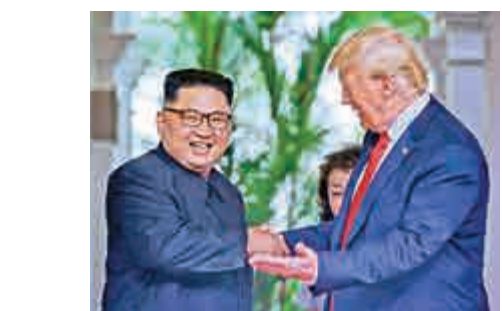
12日，朝鮮領導人金正恩（左）與美國總統特朗普親切會晤

在特金會前，《勞動新聞》的讀者們讀到了一則不尋常的社論：朝鮮應與其他國家接觸。「形勢要求所有國家和人民建立公平的國際關係」。該篇社論還引述了領導人金正恩的講話：「只要所有國家和人民保持獨立，相互尊重，我們就能建立公平的國際關係，打造一個真正獨立、和平與友善的世界。」