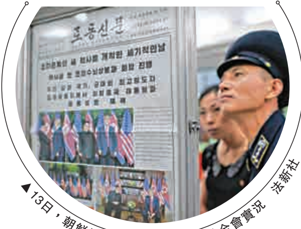
13日，朝鮮媒體罕見地大幅報道特金會實況

【大公報訊】據朝中社、英國廣播公司及路透社報道：朝鮮最高領導人金正恩12日與美國總統特朗普在新加坡會面，全球媒體鋪天蓋地報道這一歷史性事件。13日，朝鮮媒體將此次會晤稱為「世紀之會」，表示金正恩進行歷史性會面後，同意朝鮮半島無核化需採逐步方式進行，並指特朗普作出了一些讓步。同日，特朗普在推文感謝金正恩，稱全球無核化又前進了一大步。