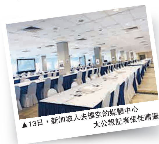
13日，新加坡人去樓空的媒體中心

雖然12日晚已經提供了「散水飯」，但國際媒體中心到13日下午6點才「打烊」，餐飲服務也維持到下午2點半。但時間一到，一樓的餐飲中心已經開始拆除，預計大樓很快將恢復F1維修中心的原貌。