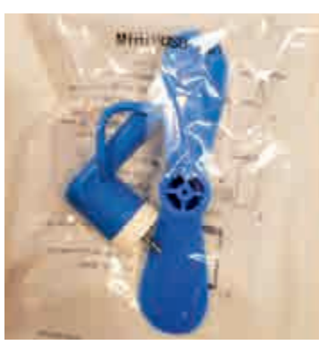
媒體記者收到的USB風扇

主角是只有一片扇頁和一個USB接口的小風扇，是主辦方為天氣炎熱，貼心地準備的降溫消暑「神器」。不料，英國BBC稱，這個USB設備可能帶有惡意軟件。有報道指，美國《華盛頓郵報》記者格爾曼 (Barton Gellman) 還告誡同行，不要把這個USB設備插入電腦或