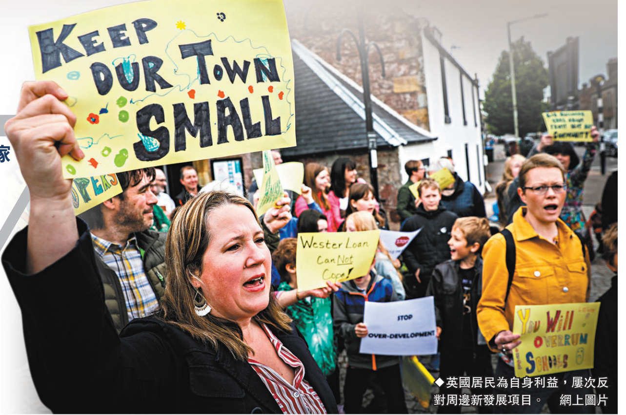
◆英國居民為自身利益，屢次反對周邊新發展項目。

位於英格蘭中部、汽車品牌積架越野路華總部所在地的考文垂，是英國近年其中一個發展迅速的城鎮，當地市中心附近有一塊廢棄煤氣廠用地，於去年10月獲批准重建，將會興建700套住房。不過這個重建項目由提出到獲批，前前後後原來花了好幾年時間的談判，重建計劃不但兩度被公眾組成的「規劃委員會」駁回，更受到附近約100名居民聯署反對，最終發展商和支持項目的市政府要在樓宇高度甚至外牆牆磚紋理等不同細節上作出讓步，項目才能獲得批准，事後負責項目的規劃顧問直言對居民的反對感到「完全困惑」。