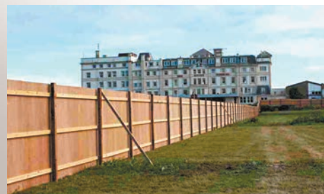
◆英國過去十年有110萬幅獲得規劃許可的土地長期丟空。網上圖片

香港文匯報訊(特約記者 周天梧 倫敦報導)雖然「鄰避效應」被視為英國建屋難的原因，不過在一些支持保護鄉村和綠化地的團體眼中，私人發展商為了提高利潤而「囤地」的做法，才是導致英國房屋供應無法增加，且樓價長升有長的元兇。