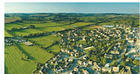
◆「綠帶」概念影響往後幾十年英住宅發展的規劃法例。

大，「綠帶」被引入到倫敦以外的地區，自此英格蘭各大城鎮能夠發展的土地，都只能限於規劃部門指定的非綠帶區域，這一制度一直延續至今。由於無法有效使用綠地，歷屆中央和地方政府只能靠其他方式增加房屋供應，包括增加城市住屋密度，但都不能提供足夠的房屋來滿足需求。由於英國規劃制度對綠地的發展限制實在太嚴，加上還有環保之類的爭議，以致政客都不敢對綠地出手。英國首相蘇納克早前就提出要加大發展棕地，並承諾保護「寶貴的」綠地，不過有規劃顧問指出，即使在現有可發展棕地上全部都興建住宅，它們也只能滿足未來15年英格蘭住屋需求的不到三分之一，而且最終能否建成還遠未確定，因為很多土地要不是受到污染，就是缺乏基礎設施，或者不在人們想要居住的地方。