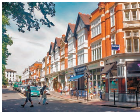
◆倫敦伊靈區居民習慣住在兩三層高的洋房。

記者所居住的倫敦伊靈區，近年因為可以半小時直達市中心的地鐵伊利沙伯線的通車，成為倫敦最炙手可熱的一個住宅區，縱使區內樓價和租金不斷上升，但房屋仍然是供不應求，不少發展商因此看中區內一些已經非常殘舊的低密度地段，進行收購並打算重建成住宅大廈。不過這些發展項目卻遭到周遭的居民，尤其是持有自住物業的業主反對，以致項目進度非常緩慢。