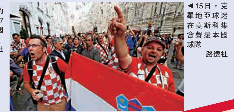
▲15日，克羅地亞球迷在莫斯科集會聲援本國球隊