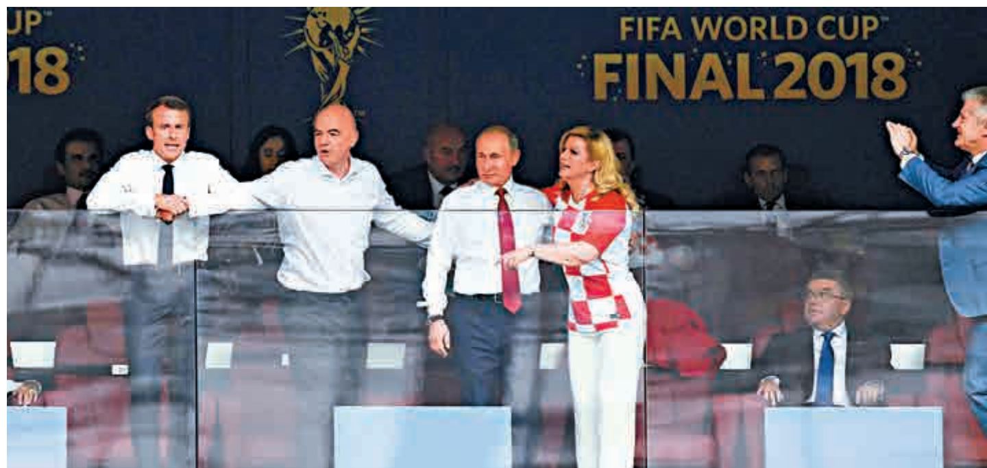
▲(從左至右)法總統馬克龍、FIFA主席恩芬天奴、俄總統普京和克羅地亞總統基塔羅維奇15日在莫斯科觀看世盃決賽

一個月前，各國準備前往俄羅斯觀賽的球迷被警告，他們要為自己的安危負責，俄羅斯被描繪稱一個世界舞台上的反派。然而，這一個多月，俄羅斯安寧得令人難以置信，普京甚至感謝俄羅斯球迷，因為他們克制冷靜，沒有發生一次敵對球迷之間的暴力衝突。人們此前在擔心足球流氓，但俄羅斯卻向他們展示了自己是好主人。而到訪俄羅斯的各國足球明星，評論員和民眾，