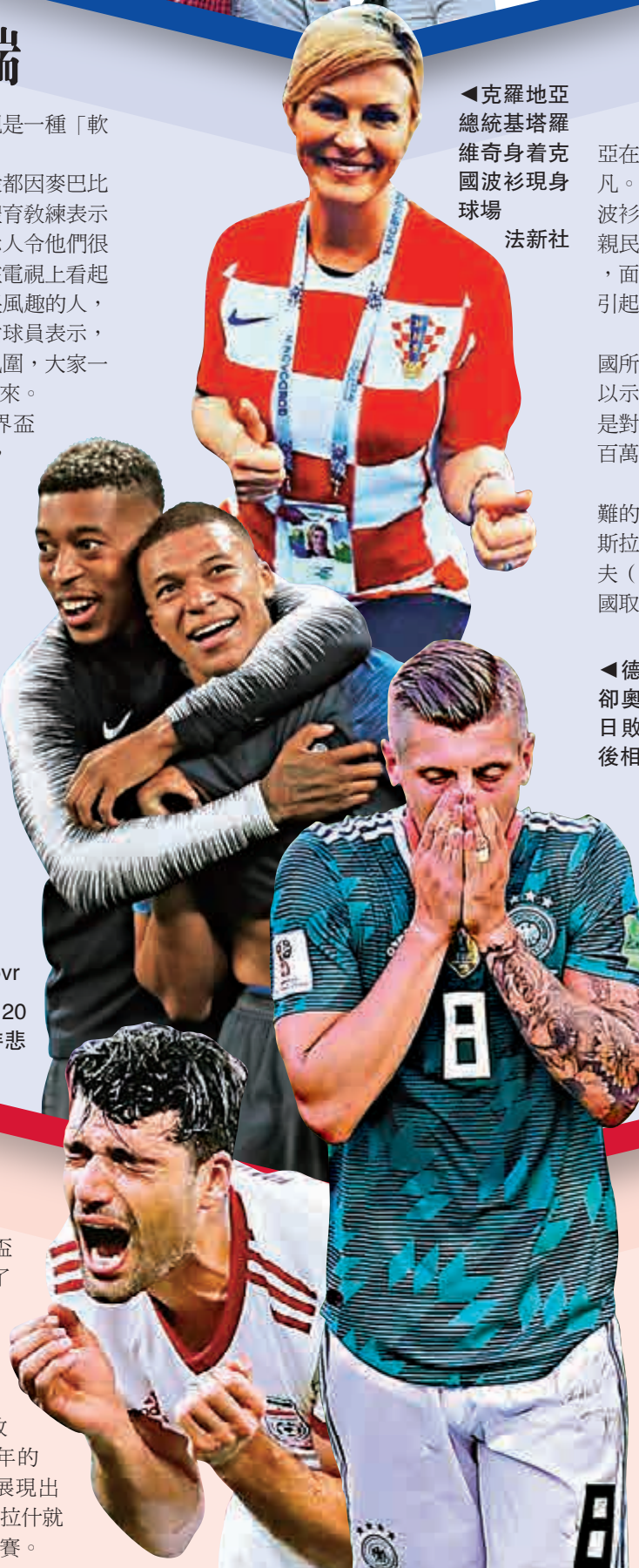
▲克羅地亞總統基塔羅維奇身著克國波衫現身球場