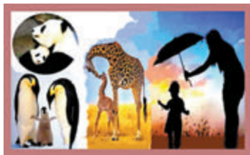
任何生命無不需要母愛。 母愛的光輝，亂世如何顯現出來！