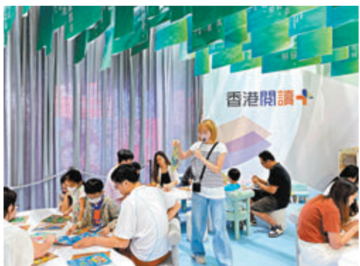
◆親子工作坊吸引市民參加。