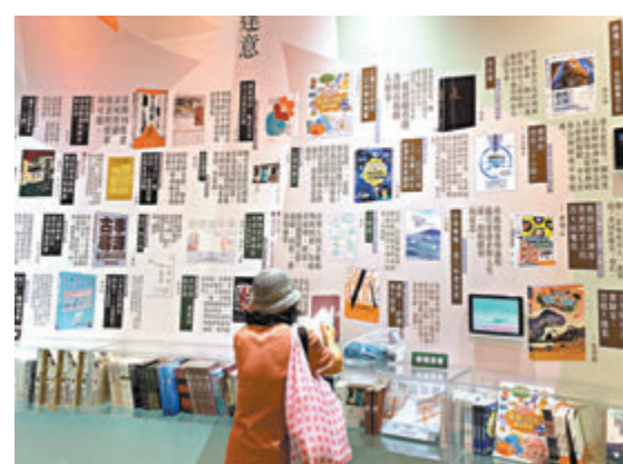
◆「2024 香港閱讀+」吸引市民駐足。