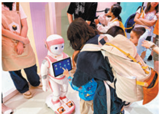
◆小朋友們爭先體驗「領讀機械人」。