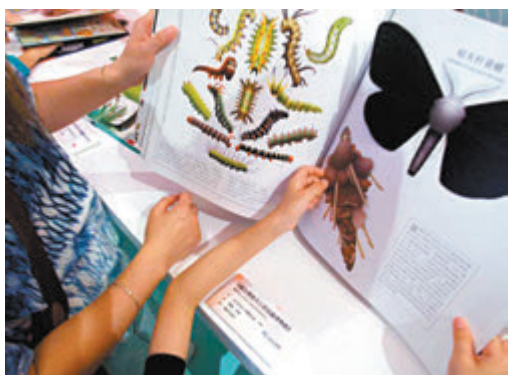
◆小讀者發現自己感興趣的書。