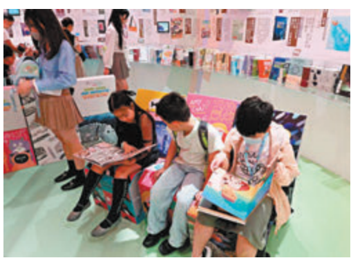
◆現場小朋友聚精會神閱讀。

「2024 香港閱讀+」請來多位文化名人，包括意大利暢銷科普故事系列《好奇水先生》著名作家及插畫家 Agostino Traini、「斷捨離」概念創始人山下英子、廣東省作家協會副主席楊黎光、北京大學中文系教授張頤武，以及本地作家米哈、英華小學校長陳美娟、香港乒乓球隊總教練李靜等，向大眾推介優秀的出版物，推廣閱讀文化。