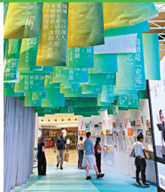
◆在商場中打造一塊閱讀綠洲。

本屆「2024 香港閱讀+」特設購書專區，逾千本香港出版的優秀書籍以低至半價即場發售，在「香港全民閱讀日」前夕給予大眾購入優質圖書的渠道，鼓勵大眾以書為伴。正值周末，不少市民家庭帶孩子前來，童書和生活類圖書最受歡迎。傍晚時分，山下英子還來到購書專區舉行《俯瞰力》新書發售活動，再度吸引了來往行人的購書熱情。有市民表示本來只是經過商場，看到有優惠購書的專區，於是吸引下手一直想買的生活讀物，還為孩子選購了一本繪本。