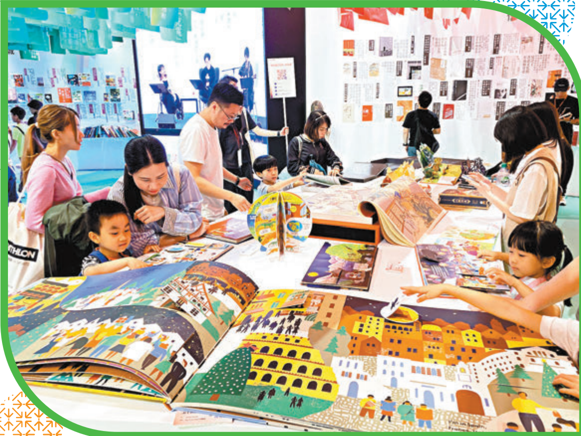
◆立體書展示吸引目光。

現場亦舉辦約20場推廣閱讀的親子活動及工作坊，覆蓋講故事、非遺手工創作、STEM 實驗小教室、製作伴讀小夜燈、自製繪本工作坊及面部彩繪等。在活動開幕當日的親子工作坊中，不少家庭成員齊上陣陪伴孩子參與閱讀和手作活動，配合工作坊現場老師的導引，不少家庭都表示雖然是免費活動卻非常有收穫感，讓他們感到十分驚喜。