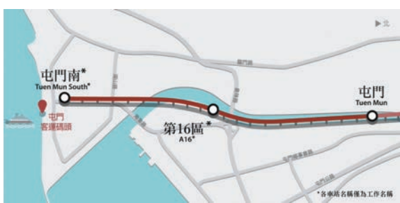
行政長官會同行政會議昨日批准古洞站和屯門南延線項目的財務安排，圖為屯門南延線路線。

至於屯門南延線項目，行政會議批准向港鐵公司批出屯門第十六區約6公頃用地作綜合商業和住宅用途的物業發展權，以及將來從按「設有鐵路」基礎評定的