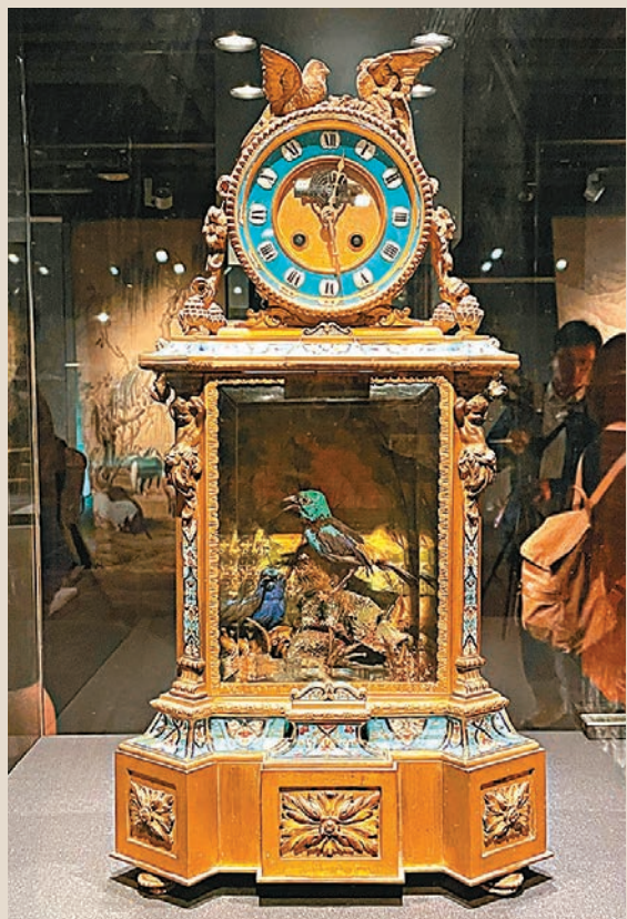
銅鍍金絲琺瑯高音鐘