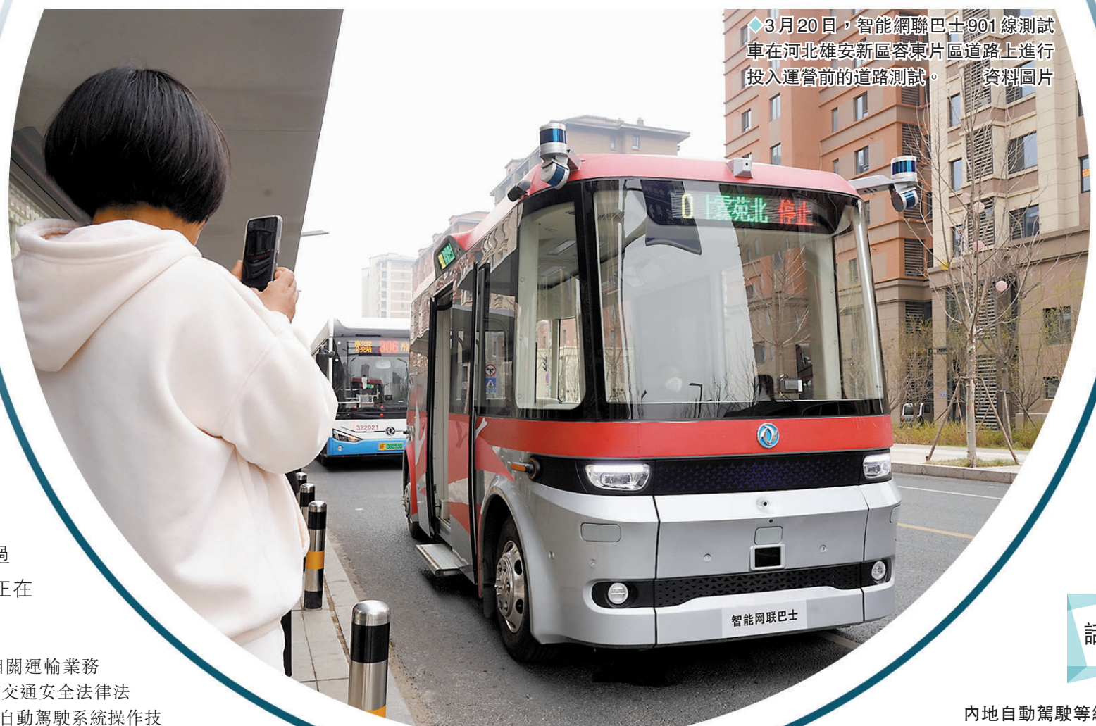
◆3月20日,智能網聯巴士901線測試車在河北雄安新區容東片區道路上進行投入運營前的道路測試。 資料圖片

南山科技園、後海總部基地片區是深圳乃至大灣區最活躍的商務、科技與金融區域之一,很多頭部企業總部設立在此,往返密集的商務人士多次主動提出需要一種快速舒適的、國際化的通勤方式。東部通航將以市場化運作模式,創新發展城市立體交通(UAM)服務應用場景,推動以深圳灣片區為核心的覆蓋粵港澳大灣區的低空網絡建設,打造深圳灣與大灣區聯通的空中快速通道。