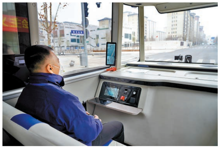
◆智能網聯巴士901線測試車的安全員在監控車輛行駛情況。

香港文匯報訊(記者 王珏 北京報道)交通運輸部最新發布自動駕駛汽車運輸安全服務試行指南,要求自動駕駛汽車應有醒目標識,客運、貨運時應隨車配備一名駕駛員或運行安全保障人員(以下統稱「安全員」)。業內人士指出,目前,中國內地已開放智能網聯汽車測試道路超過15,000公里,國家層面關於自動駕駛的相關規範、行業指引正在逐步完善,自動駕駛正在加速邁向現實。