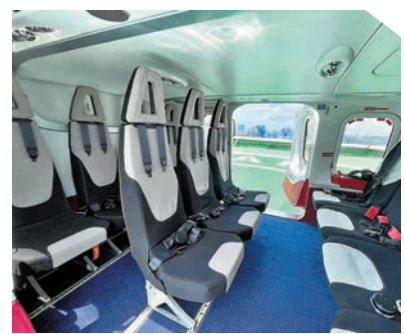
◆萊奧納多AW139直升機內部。 香港文匯報深圳傳真