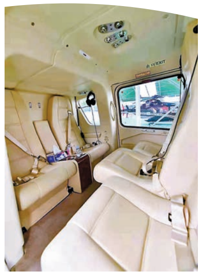
◆空客135機型內部。