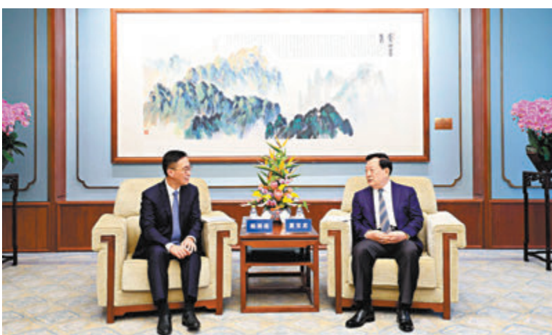
◆夏寶龍會見楊潤雄一行。

5月9日下午，夏寶龍在北京會見楊潤雄一行。夏寶龍表示，在香港由治及興的新階段，發展好旅遊業對全力拚經濟、謀發展非常重要。香港特區政府為此作出了積極努力，值得充分肯定。當前，香港內外環境發生了深刻變化，香港旅遊業發展要積極識變、應變、求變，多用新思路、新辦法解決面臨的問題，走高質量特色化之路，在變革中實現大提升。要樹立「香港無處不旅遊」的理念，充分發掘香港豐富的旅遊資源，積極借鑒各地成功經驗，創新思路、優化政策，推動社會各方力量共同參與，大力開發旅遊新路線新產品，弘揚熱情好客之道，不斷提升服務質量，把香港「最佳旅遊目的地」的金字招牌擦得更亮。中央將繼續全力支持香港旅遊業發展，堅信有「一國兩制」最佳制度保障，香港這顆璀璨的明珠一定會綻放出愈來愈絢麗的光芒。